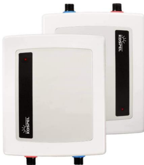
Focus LCD Electronic